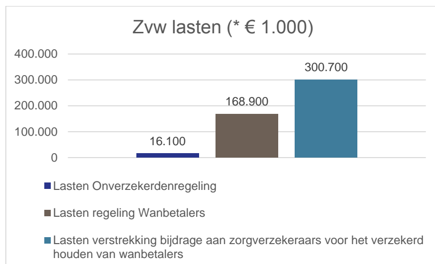
Figuur 2. Overzicht Zvw lasten in 2021