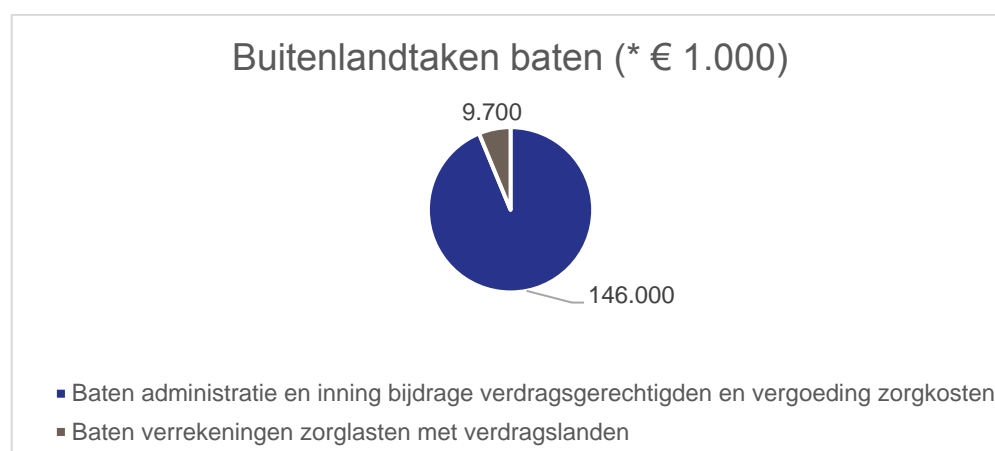
Figuur 3. Verdeling baten Buitenlandtaken 2021