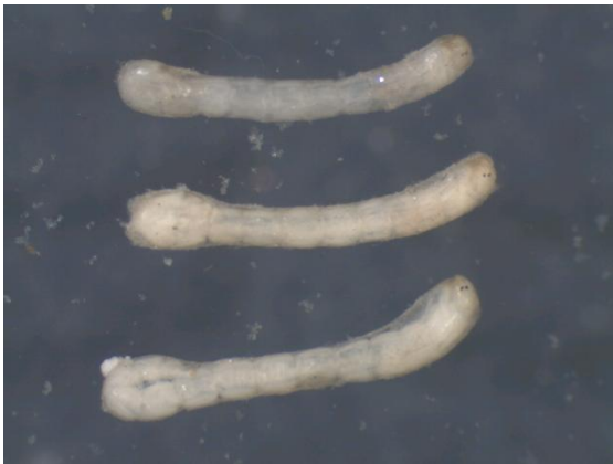
Figuur 1. Coconnen van larven van Parachironomus vitiosus (Markermeer, 2015007635).