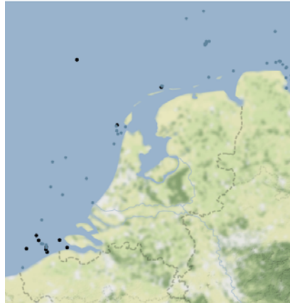
Figuur 2: Locaties in de Noordzee waar vermoedelijk munitie ligt. De blauwe stippen geven locaties aan waar conventionele munitie (bommen, granaten, torpedo's en mijnen) ligt. De zwarte stippen geven locaties weer waar de identiteit van de munitie onbekend is, maar mogelijk ligt hier ook chemische munitie (zoals mosterdgas). Hoeveel munitie er op de verschillende plekken ligt is onbekend (Ospar, 2001).

concentraties springstof in de zee en waterlichamen die in open verbinding staan met de zee.