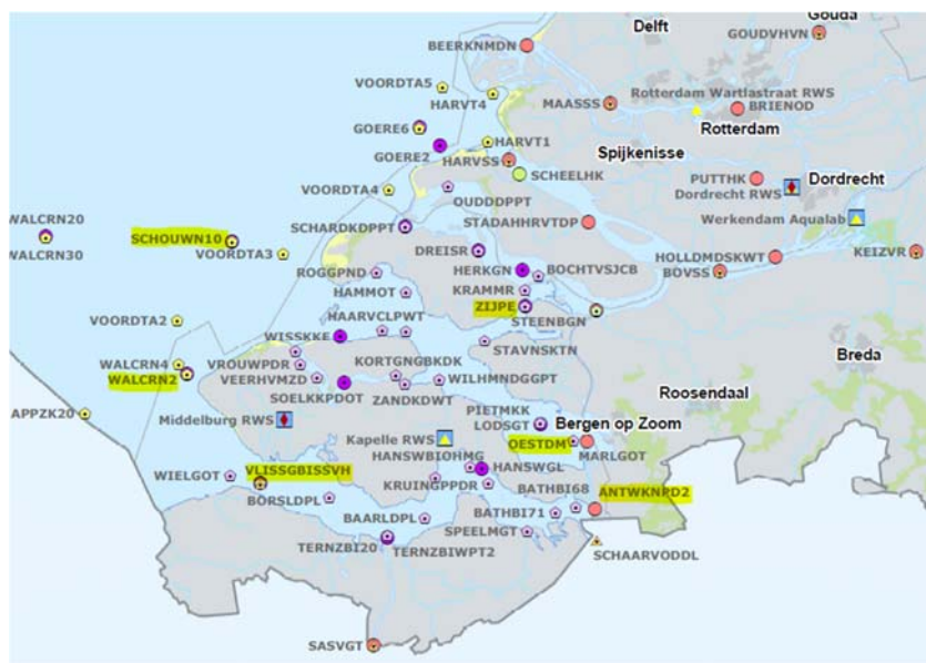
Figuur 2: Er is gekozen voor de bovenstroomse locaties Oesterdam (OESTDAM) en Zijpe (ZIJPE). Daarnaast worden in de Westerschelde de locaties Antwerps Kanaalpannd (ANTWKND2) en Vlissingen (VLISSGBISSV) meegenomen in de analyse. Ten slotte worden springstoffen en afbraakproducten geanalyseerd in de Noordzee bij meetlocaties Walcheren 2 km uit de kust (WALCRN2), Schouwen 10 km uit de kust (SCHOUWN10) en Terschelling 10 km uit de kust (TERS LG10, niet weergegeven op bovenstaande kaart).

Om te onderzoeken of de gemeten TNT in Wissenkerke van het munitiedepot afkomstig is, dan wel er sprake is van een achtergrondconcentratie als gevolg aanvoer vanaf de Noordzee, worden in 2021 op meerdere locaties monsters genomen voor de analyse van springstoffen en afbraakproducten van springstoffen. Naast watermonster vanuit de Noordzee, worden ter controle ook watermonsters bovenstrooms het munitiedepot en uit de Westerschelde geanalyseerd op de aanwezigheid van springstoffen. De geselecteerde locaties zijn in onderstaand figuur geel gearceerd.