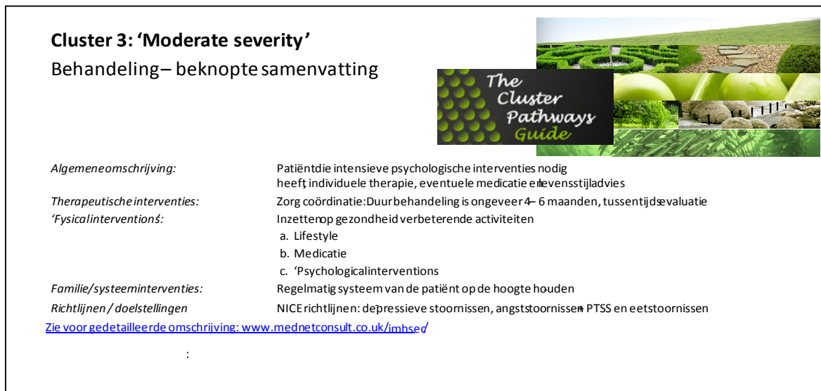
Figuur 5: Voorbeeld zorgcluster; omschrijving zorgvraag (samenvatting)