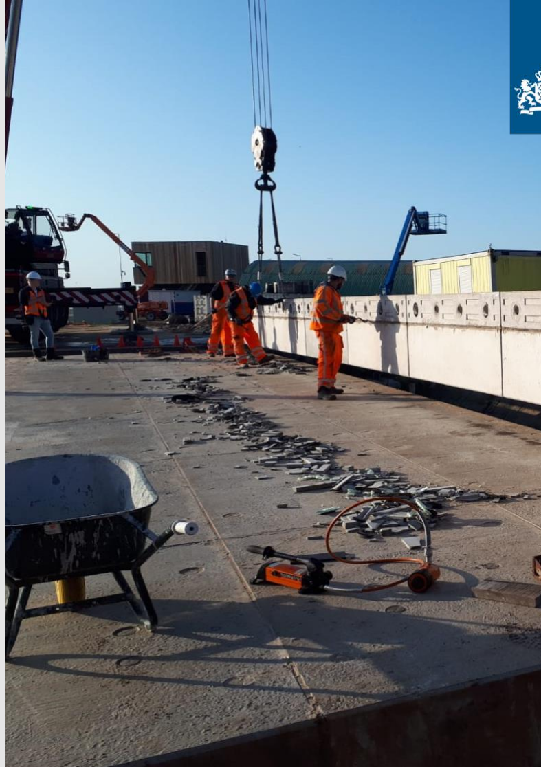
Foto: demontage van het eerste circulaire viaduct

Rijkswaterstaat realiseert en beheert een groot gedeelte van de Nederlandse infrastructuur. Deze infrastructuur willen we klimaatneutraal en circulair gaan ontwerpen, bouwen en onderhouden.