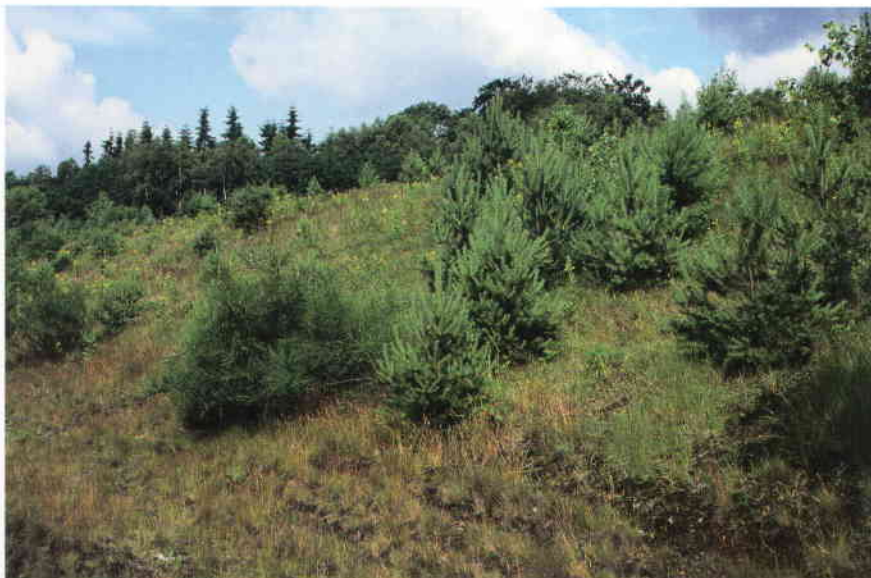
Foto 6: Natuurlijke opslag na 7 jaar op 30 cm oorspronkelijke boshumus met geel zand.

bodemafwerking en beplantingssysteem. Oudere kreupelbossen op schraal, humusarm zand kunnen rijk aan korstmossen, bladmossen en (onder meer zeldzame en bedreigde) paddestoelen zijn. Dit extreem schrale, waardevolle bostype wordt wel apart benoemd, namelijk het Gaffeltandmos-Eikenbos. Enkele soorten uit deze gemeenschap zijn op alle drie de bodems aangetroffen.