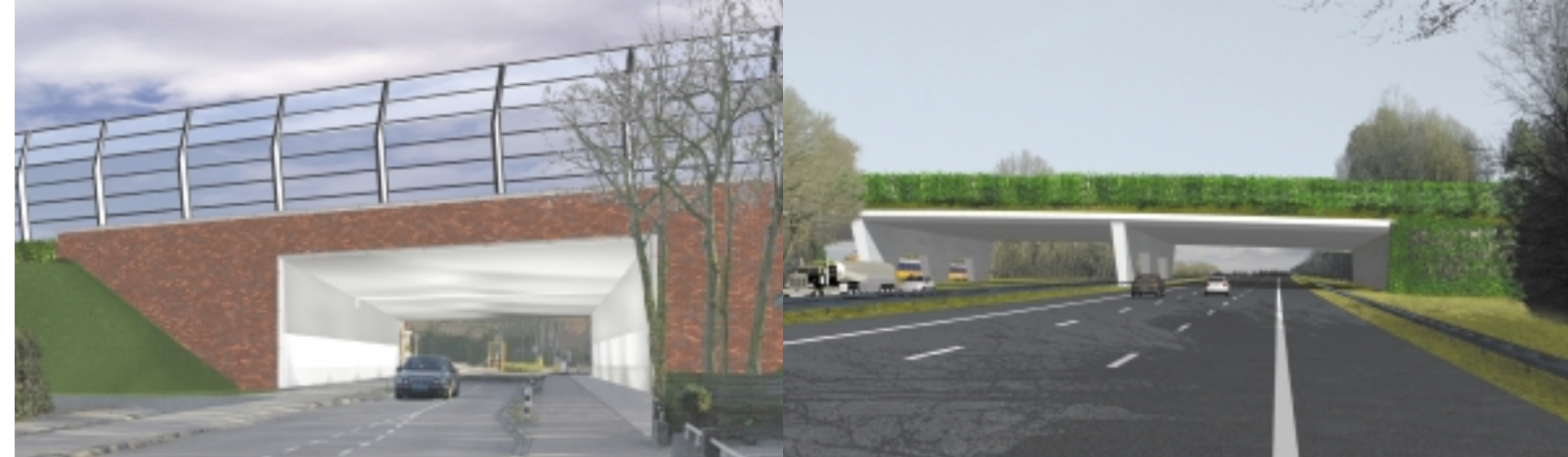
Zo ziet het Routeontwerp A12 nieuwe kunstwerken. Links de onderdoorgang in een bebost gebied, rechts een ecoduct.