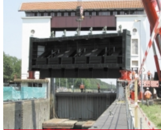
Een nieuwe deur voor de sluis Eefde.