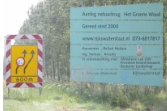
Werk in uitvoering: natuurbrug over de A2.