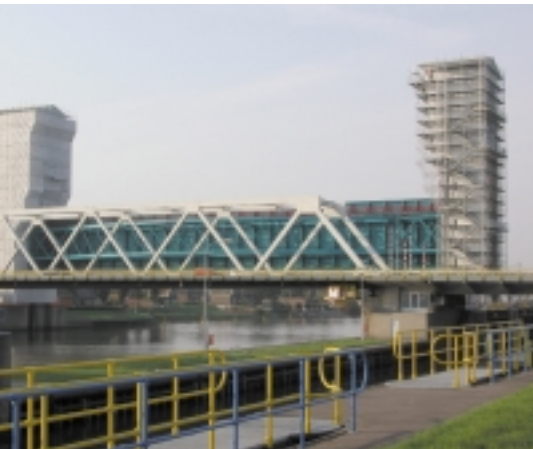
Conservering van de stormvloedkering Hollandse IJssel.