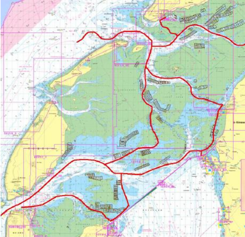
Figuur 2. Hoofdwaarwegen in de Waddenzee.

In AERIUS Calculator zijn de vaarroutes ingetekend van het door AERIUS calculator aangegeven middelpunt van de open te stellen kwadranten naar het dichtstbijzijnde hoofdvaarwater. Deze vaarroutes zijn ingevoerd als een lijnbron in de categorie “anders”. De lengte van deze ingevoerde vaarroute wordt door AERIUS Calculator weergegeven. In een spreadsheet is op basis van het aantal vaarbewegingen en de lengte van de vaarroute berekend hoeveel stikstof emissie op de vaarroute jaarlijks plaatsvindt. Daarbij is uitgegaan van bovengenoemde 0,166 kg NOx per kilometer . Het aantal vaarbewegingen naar een kwadrant betreft 2 vaarbewegingen per visdag (een visdag bedraagt 9 uur).