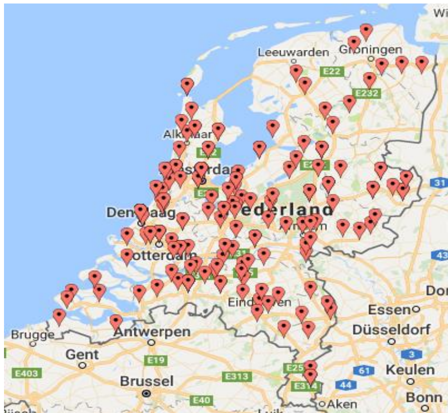
Figuur 1 Geografische spreiding van elv-aanbieders (responsgroep)