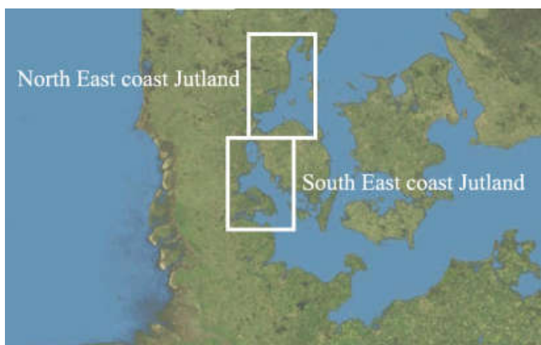
Figuur 1: De ligging van de mosselproductiegebieden langs de oostkust van Jutland (Denemarken)

De PB heeft betrekking op het uitzaaien en verwateren van mosselen afkomstig uit mosselproductiegebieden langs de oostkust van Jutland (Denemarken) op de verwaterpercelen in de Oosterschelde: