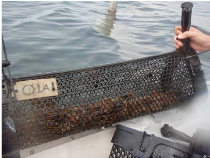
Fig. 4. Mandje voor off-bottom cultuur van oesters.