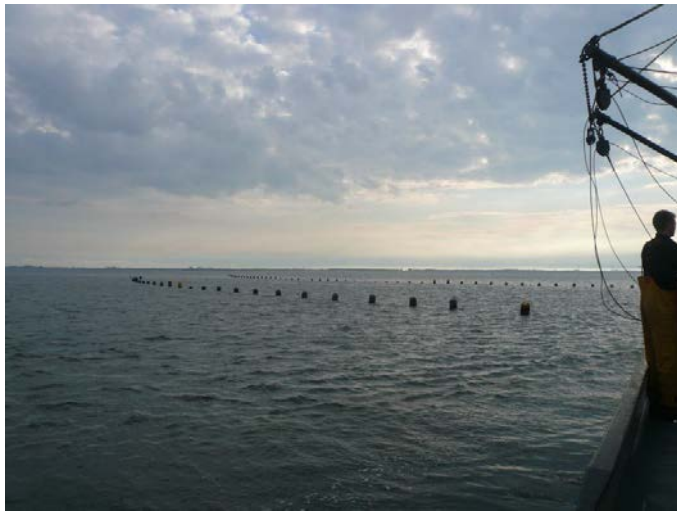
Fig. 5. Twee longlines voor off-bottom cultuur van oesters.