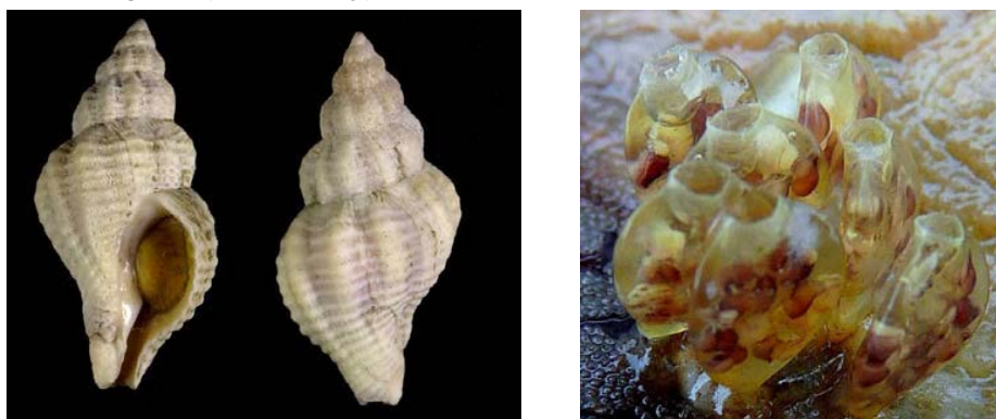
Fig 2. Urosalpinx cinerea. Rechts: ei capsules met jonge slakjes nabij Gorishoek, The Netherlands.