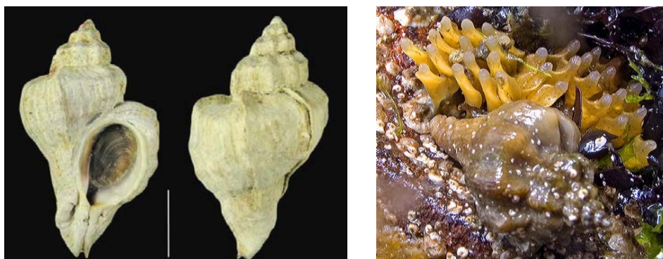
Fig 1. Ocenebra inornata (foto: L. Schroeder, found at http://www.bily.com ). Rechts: ei capsules en slak (Image: http://www.cryptosula.nl ).

Daarnaast is er een probleem met oesterboorders die in de Oosterschelde zijn geïntroduceerd, nl. de Japanse oesterboorder Ocenebra inornata en de Amerikaanse oesterboorder Urosalpinx cinerea (Fig. 1 en 2). De eerste meldingen van de Japanse oesterboorder dateren van 2007 (Faase & Ligthart, 2009), maar het is mogelijk dat de slak al langer aanwezig is en niet eerder correct is gedetermineerd (Faase & Ligthart, 2009). De Amerikaanse oesterboorder is tot nu toe alleen aangetroffen op 1 locatie in de Oosterschelde, bij Gorishoek.