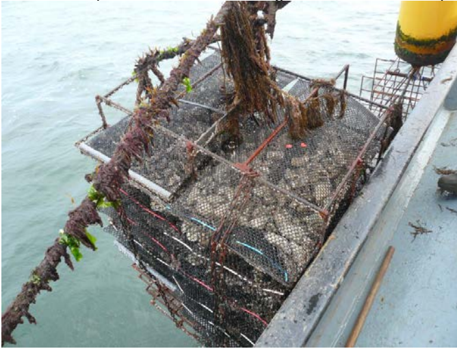
Fig. 4. Kooi met zakken voor off-bottom cultuur van oesters.

oogst een verwachte massa van 14 kg oesters. Per perceel zal 1 longline en 2 rijen met duo kooien op het diepste deel van het perceel worden geplaatst. Het benut oppervlak per longline is 4.800 m 2 en per rij van 100-duo kooien is dat 1.000 m 2 . In totaal wordt ernaar verwachting een voorraad gekweekt van maximaal 381.000 kg (300 duo-kooien met totaal 12.000 zakken, 300 duo-kooien met totaal 12.000 mandjes en 3 longlines met totaal 4.500 mandjes, dat is totaal 381.000 kg bij oogst). Deze teelt vervangt de teelt op de bodempercelen. Bij gebruik als bodemperceel hadden de percelen een voorraad van maximaal 144.000 kg bevat. De extra aanwezige biomassa is dus lokaal 237.000 kg meer. Ten opzichte van een totale geschatte voorraad op de percelen van 10 mln kg is dat 2,4 %.