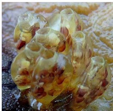
Fig 2. Urosalpinx cinerea. Rechts: ei capsules met jonge slakjes nabij Gorishoek, The Netherlands.