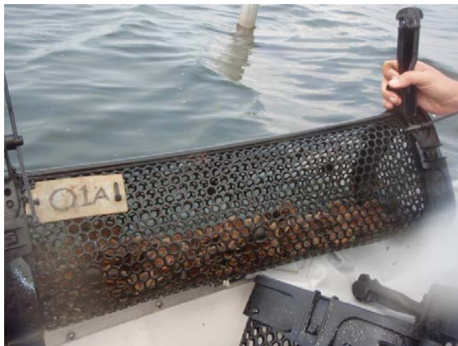
Fig. 5. Mandje voor off-bottom cultuur van oesters.