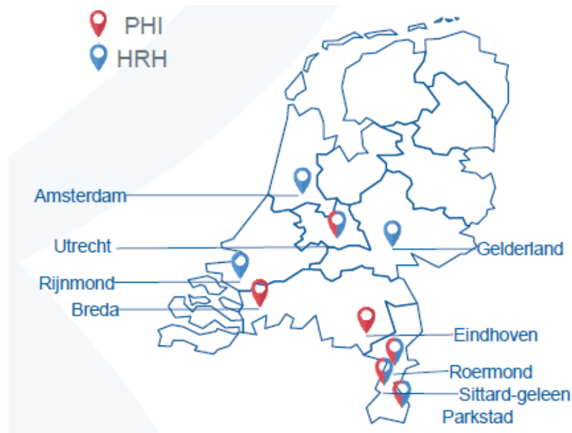
Figuur 1 - Locaties PHI en Het Rughuis (HRH)*

*In Amsterdam is sinds begin 2023 ook een PHI-locatie. Dit is niet in het kaartje weergegeven.